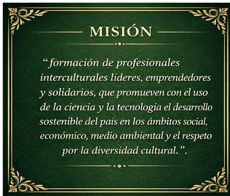
Figura 3. Misión Institucional

El presente Plan Estratégico establece los lineamientos que debe seguir la comunidad universitaria, como guía principal para lograr la misión de nuestra Universidad.